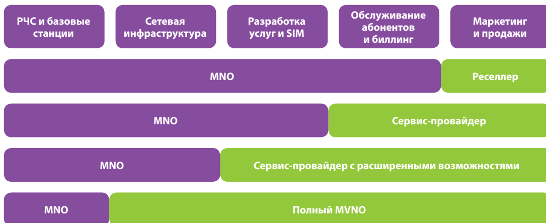
Рисунок 2. Типы операторов MVNO

С учетом использования различных типов MVNO перспективными направлениями их развития можно обозначить следующие: